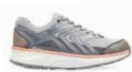
ELECTRA LIGHT GREY